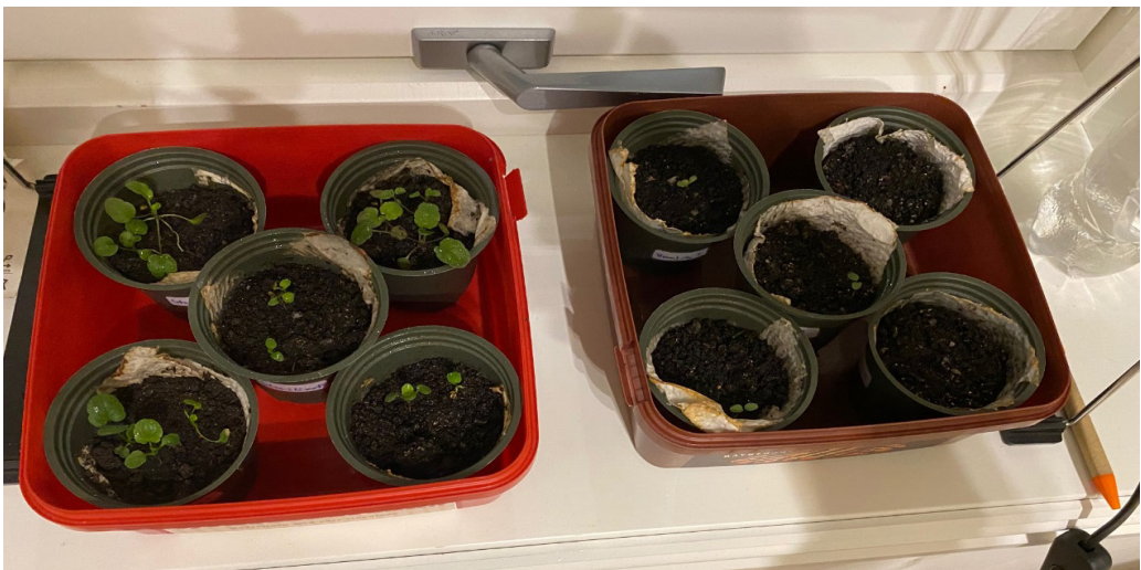
Figur 2 viser plantene i sterilisert jord (til høyre) og plantene i ikke-sterilisert jord (til venstre) rundt siste måling (ca. 2. januar 2021).