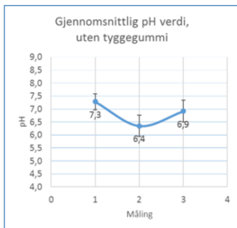
Figur 2: pH-målinger av 6 forsøkspersoner under testen av uten tyggegummi. Kurven i grafen viser gjennomsnittsverdiene på målingene med standardfeil.