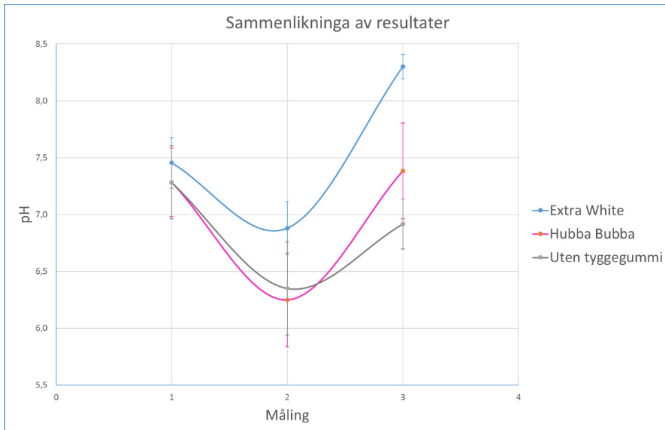
Figur 4: Sammenlikning av gjennomsnittsverdiene for hver av forholdene.