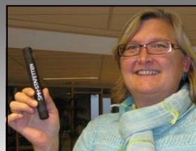
Trine Remvik Helsedirektorates bibliotek Oslo SMH-nytt nr 1/2, 2010