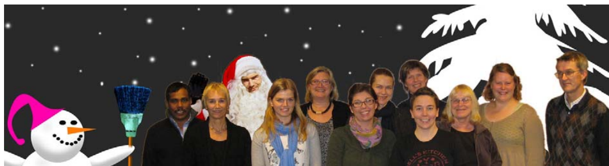
Avdeling bibliotek og publikasjoner i julemodus! God jul og godt nytt år til dere alle!

http://www.helsedirektoratet.no/omdirektoratet/roller/samfunnsoppdraget_og_rolla_til_helsedirektoratet_6_0638