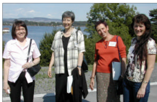
Walk & Talk på Fornebu, juni 2003