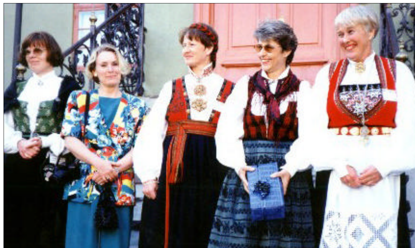
Den lokale organisasjonskomiteen Oslo 94:

styre, og har til enhver tid to medlemmer i EAHIL Council. I 1996 ble SMH presentert på EAHIL-konferansen i Coimbra. Alt dette er med på å sette SMH på det europeiske fagkartet!