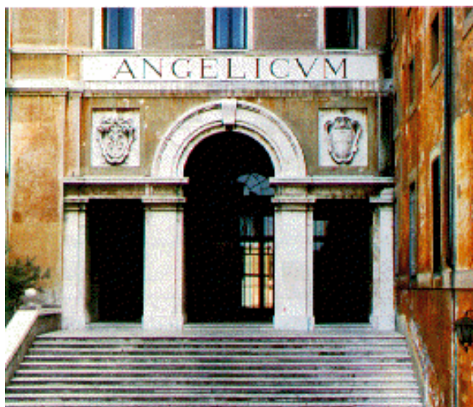
Università S. Tomasso D'Aquino

Lørdag ettermiddag avsluttet en fem dager lang opplevelse. Faglig påfyll, innspill til ettertanke, utsøkt mat, vakre orgeltoner og hyggelig samvær varmet godt i allerede høstkalde Roma.