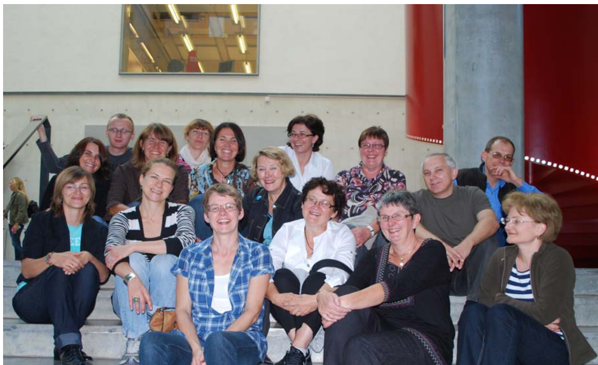
Deltakerne i MedLibTrain på prosjektmøte i Bergen september 2010.