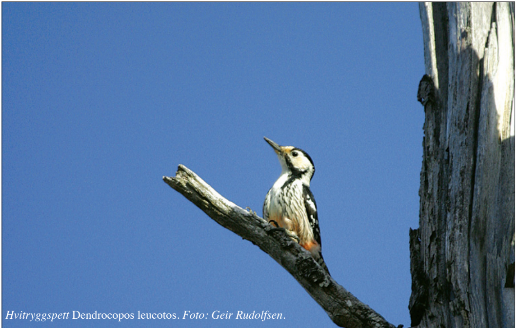
Hvitryggspett Dendrocopos leucotos .