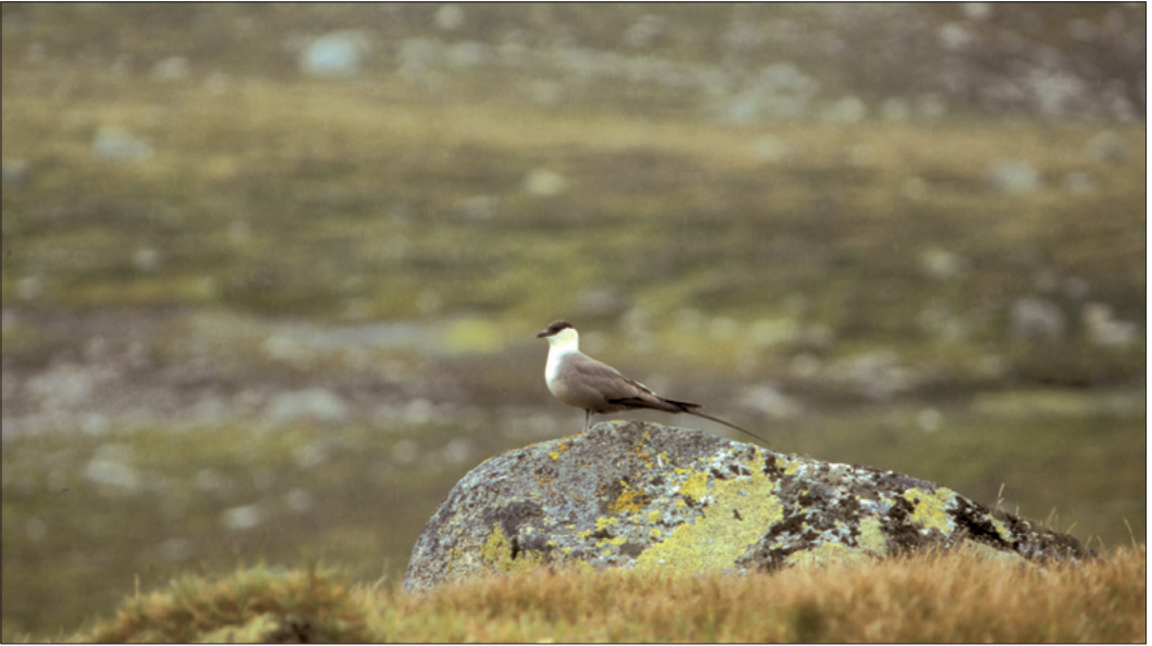
Koller og hauger i terrenget er foretrukne sitteplasser for den ikke-rugende voksenfuglen. Da har de god oversikt og kan lett oppdage potensielle farer på lang avstand.