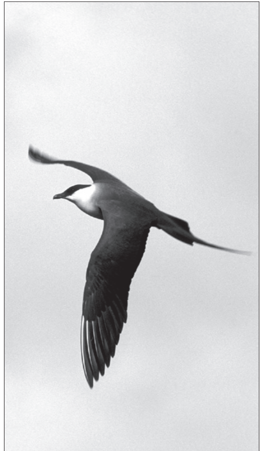
Voksen fjelljo Stercorarius longicaudus på Hardangervidda juli 2001.