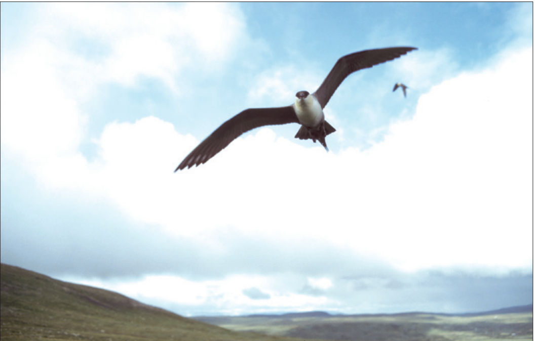
Når fremmede inntar fjelljoens territorium, kan de være meget aggressive mot inntrengerne. Aggresjonen varierer mye fra par til par. Fuglene på bildet var av de mer hissige på Hardangervidda i 2001.