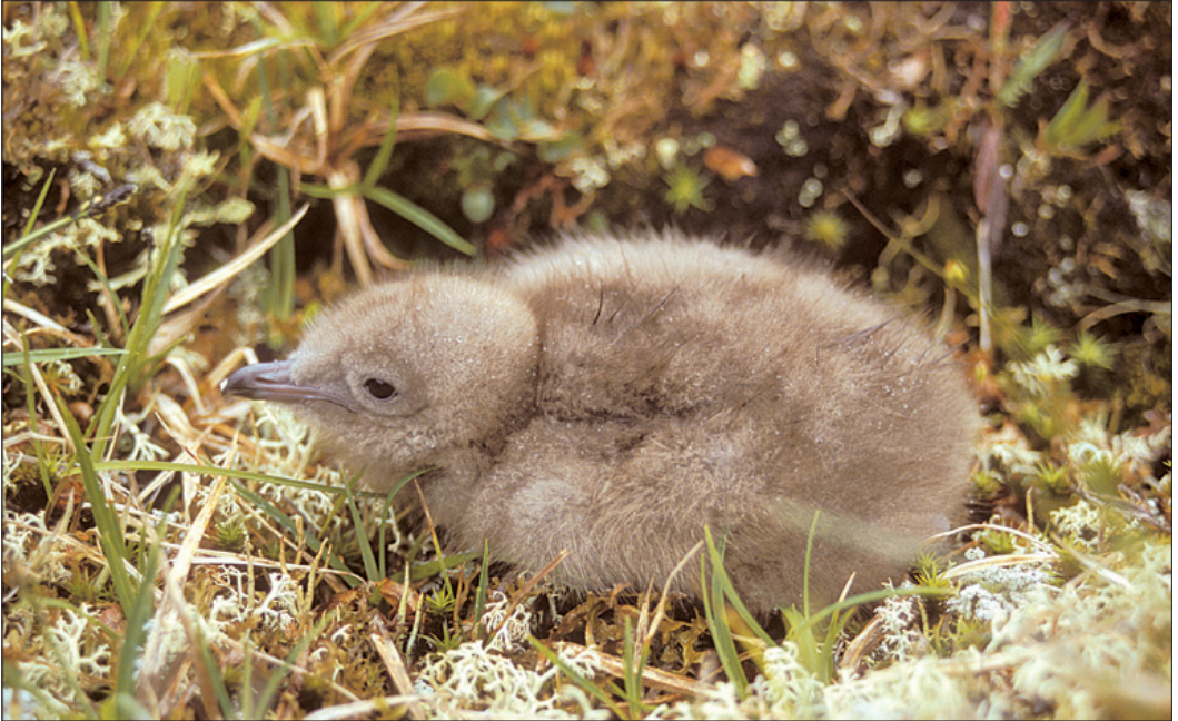
Fjelljo Stercorarius longicaudus pullus på Hardangervidda juli 2001. En av foreldrene til dette ukesgamle individet er avbildet på side 91. Paret la to egg, men kun en unge var igjen seinere på sesongen.