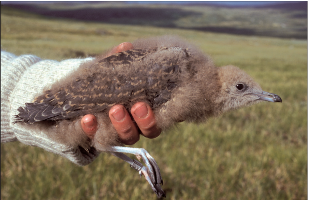
Fjelljo Stercorarius longicaudus pullus på Hardangervidda juli 2001. Fuglen er 2-3 uker gammel.