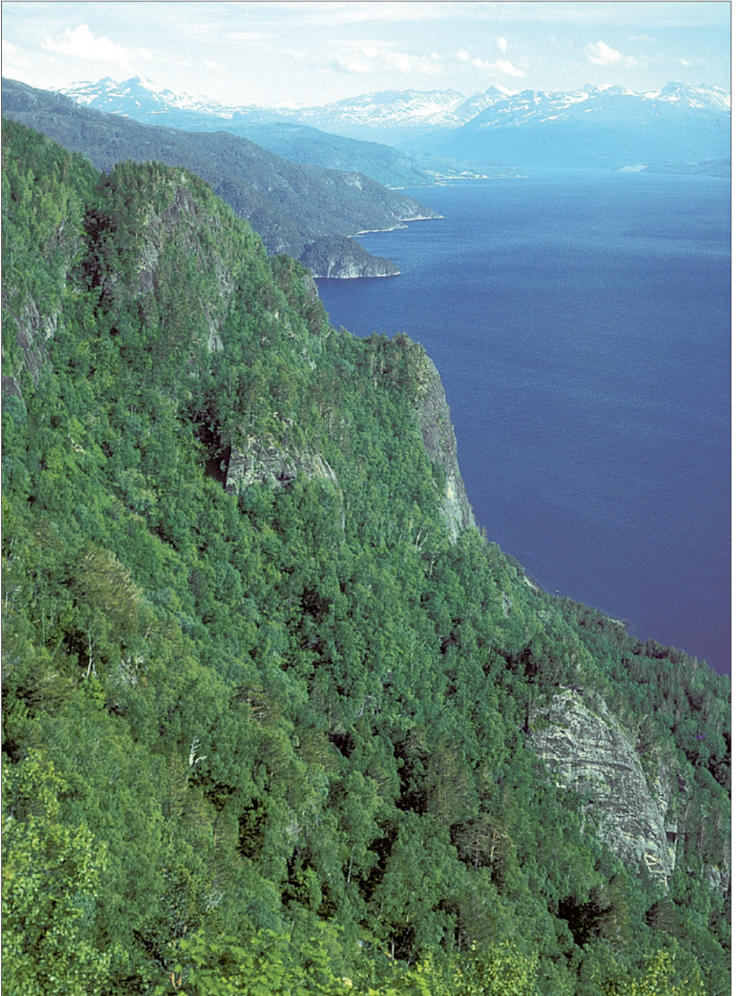
Figur 1. Typisk hekkehabitat for kvitryggspett i fjordstroka på Nordmøre.