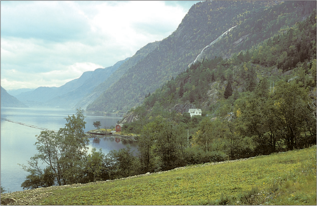
Figur 2. I dei bratte lauvskogsliene langs Sør fjorden i Indre Hardanger har kvitryggspetten kanskje si høgaste tetthet i Fennoskandia.

påverka habitatvilkåra for kvitryggspetten på lang sikt, men konkret kunnskap om effekten på bestanden manglar.