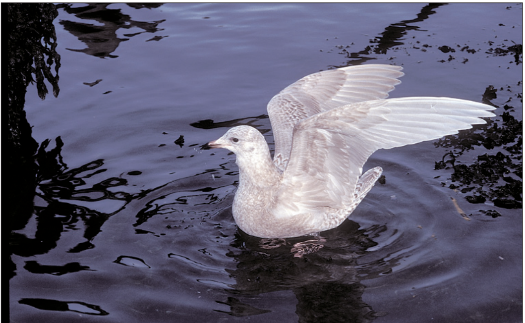
Etter å ha ligget bortgjemt i over et tiår ble denne grønlandsmåken av underarten kumlieni som gjestet Levanger (NT) vinteren 1993-1994 endelig behandlet av NSKF.