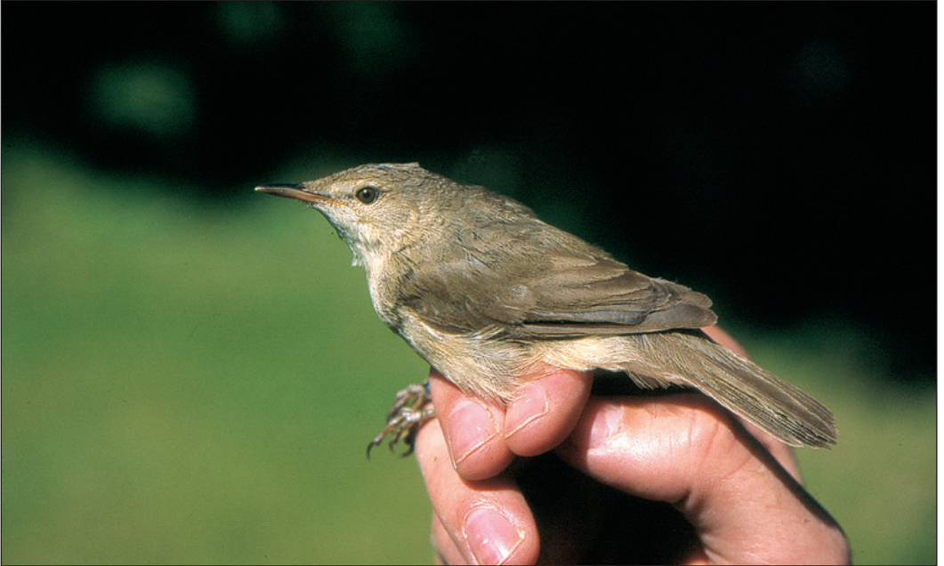
Med sju funn ble 2002 et rekordår for busksanger Acrocephalus dumetorum i Norge. Denne fuglen ble ringmerket på Lista fyr, Farsund (VA) 7. juni 2002. Legg merke til ansiktstegninger, ryggfarge og kort håndsvingfjærprosjeksjon som er med på å skille busksanger fra nært beslektede arter.