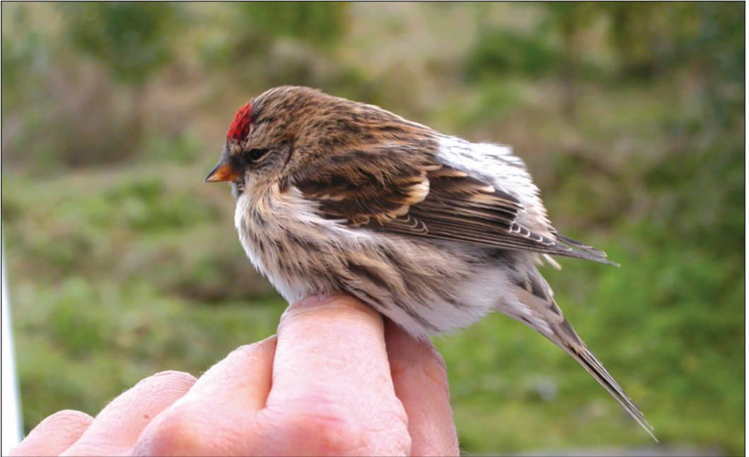
Gråsisik Carduelis flammea av underarten rostrata ringmerket på Titran, Frøya (ST) 12. oktober 2003. Underarten er identifikasjonsmessig utfordrende, og denne fuglen ble identifisert på en kombinasjon av relativt lang vingelengde (80 mm), relativt ensfarget varmt brun mantel, beigebrun grunnfarge i strupe og bryst i kontrast til hvit grunnfarge i buken og lyse vingebånd med klart beigebrunt anstrøk. Hodetegningene er også typiske med tydelig mørk maske, stor svart hakelapp, stor svart tøyلة og brun øyenbrynstrek.