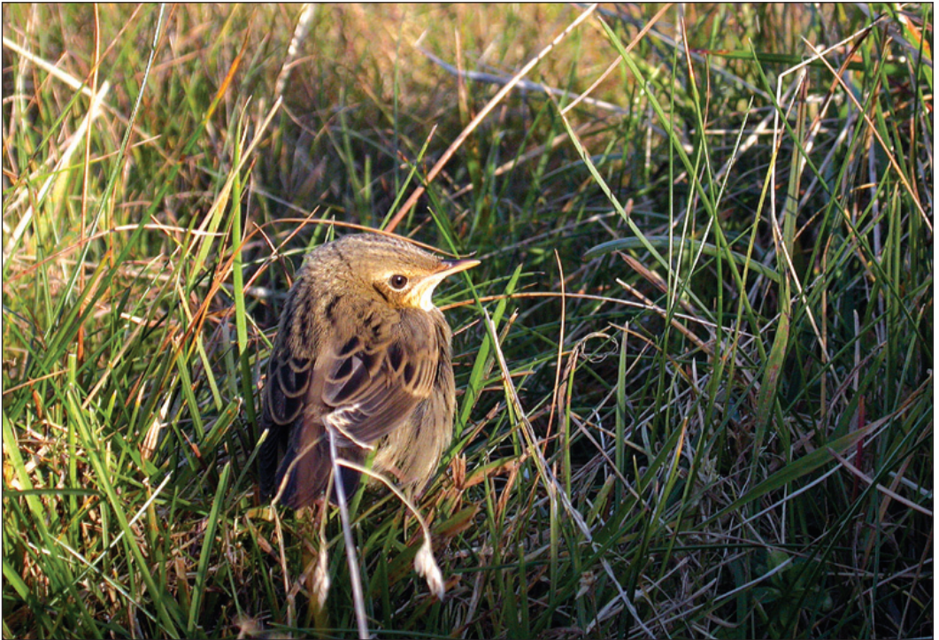
Stripesanger Locustella lanceolata viser som regel en utpreget krypende atferd på trekklokaliteter. Denne fuglen fra Fedje (HO) 15. oktober 2003 lot seg imidlertid av fotografere før den ble fanget inn for sikker artsbestemming.