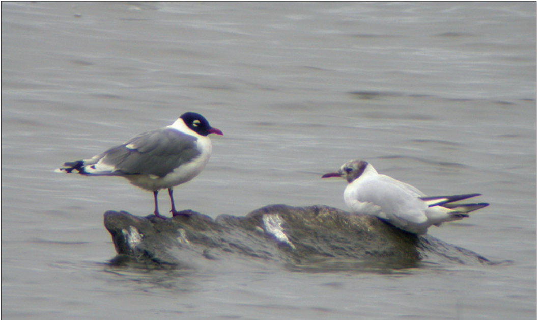
Franklinmåke Larus pipixcan t.v. sammen med hettemåke Larus ridibundus Årnestangen, Rælingen (OA) 7.-11. juli 2003. Legg merke til forskjell i mantelfarge i forhold til hettemåken, samt strukturforskjeller i hode og nebb.