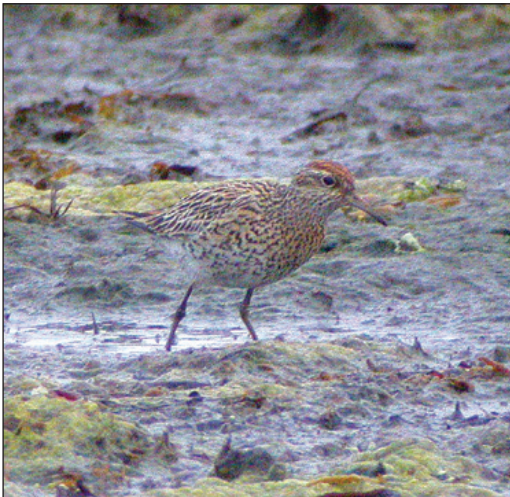
Spisshalesnipe Calidris acuminata fra Gaulosen, Trondheim (ST) 24.-25. juni 2003. Bildet viser klassiske kjennetegn som den rødbrune kalotten og fyldig mørk flekking i bryst og flanker som strekker seg langt ned på buken.