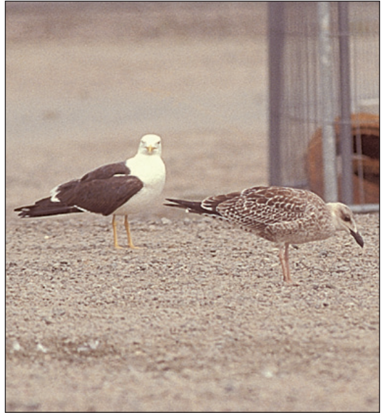
De to første godkjente funnene av gulbeinmåke Larus michahellis i Norge ble begge gjort på Gismerøya i Mandal (VA) i 2003. Begge funnene gjelder 1K-fugler tidlig på høsten. Bildet t.v. viser fuglen fra 1.-7.9, og bildet t.h. fuglen fra 30.-31.7. Legg spesielt merke til tegninger i vinge, stjert og hode som er viktig for å skille ut denne arten.