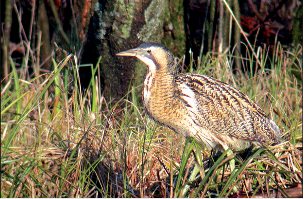
Rørdrum Botaurus stellaris er kjent for sitt tilbaketrukkne levevis i takrørskoger, men denne fuglen som gjestet ulike lokaliteter i Bergen (HO) i nærmere fire måneder fra 21. januar 2003 eksponerte seg til tider uvanlig godt.