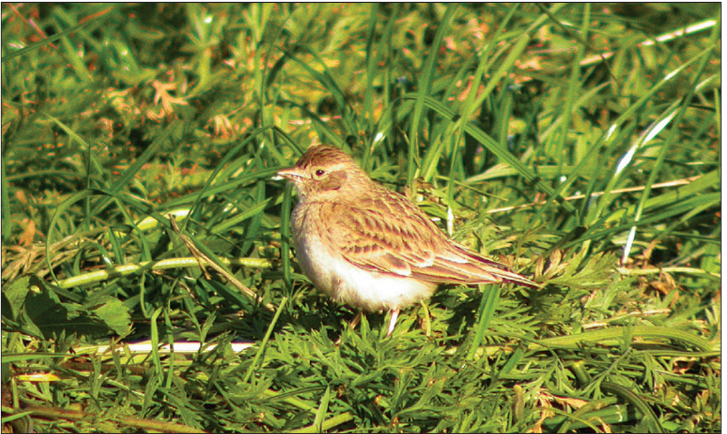
En av to dverglerker Calandrella brachydactyla fra Utsira (RO) i 2003. Fuglen holdt seg på øya i store deler av oktober og inn i november måned.