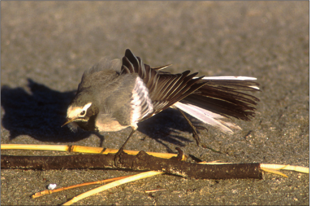
Denne velkjente linerlen Motacilla alba representerer det første funnet av underarten personata i Nord Europa. Fuglen overvintret på Listastrendene i Farsund (VA) og fikk etter hvert stor oppmerksomhet langt utenfor landets grenser.

1997 ROGALAND: 1K+ Utsira, Utsira 10.10 (*H.Kvam, K.Aa.Solbakken, E.Thesen, A. Amundsen, R.Solvang, K.R.Mjølshnes m.fl.).