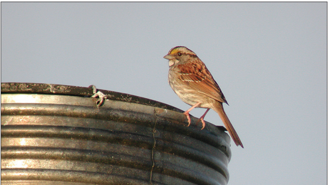
Norges andre funn av hvitstrupespurv Zonotrichia albicollis kom noe overraskende året etter førstefunnet i Sør-Trøndelag. Selv om fuglen verken ble sett i juli eller august antas observasjonene fra juni og september 2003 å gjelde samme individ. Den lange fraværperioden kan trolig tilskrives lite besøk av fuglekikkere i dette tidsrommet.