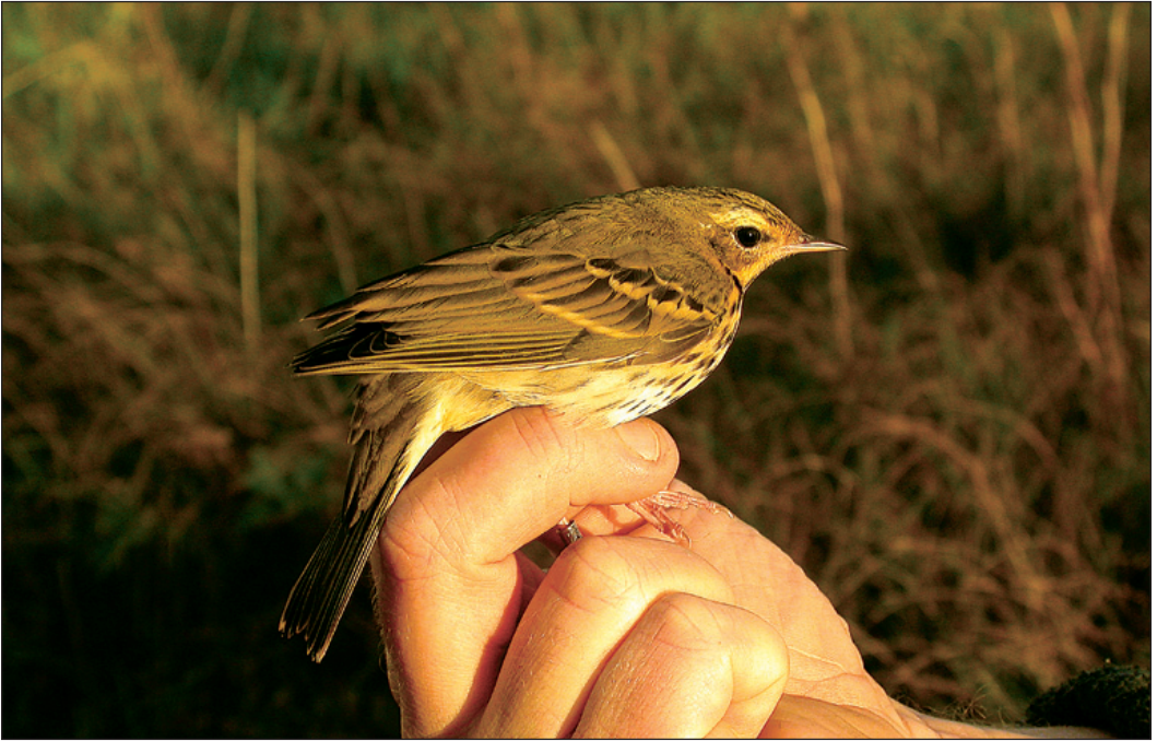
Sør-Trøndelags første sibirpiplerke Anthus hodgsoni ble ringmerket på Titran, Frøya (ST) 27. september 2003. Arten har gjerne kryptisk atferd under trekket. Denne fuglen ble først kun sett glimtvis i en hage, og ble derfor innfanget for sikker identifikasjon og dokumentasjon.