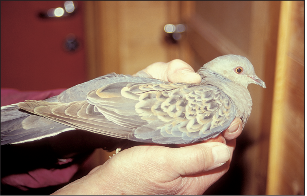
Mongolturteldue Streptopelia orientalis fra Meløy (NO) 21. november 2003 og ut året. Dette er andre funn av underarten meena og femte funn av mongolturteldue i Norge. Fuglen ble funnet utmattet og tatt i forvaring hos en duerøker gjennom vinteren.