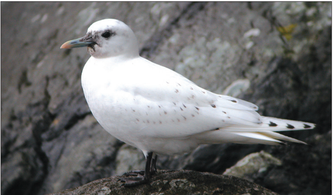
Ismåken Pagophila eburnea som gjestet Bømlo (HO) 4.-6. mars 2003 er blant de sørligste funnene av arten i Norge. I likhet med de fleste andre ismåker påtruffet på det norske fastlandet var fuglen i første vinterdrakt.