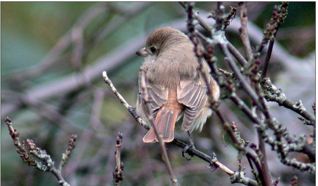
Det andre funnet av rødhalevarsler Lanius isabellinus i 2003 omfattet en 1K-fugl i Øygarden utenfor Bergen (HO) 15. november.