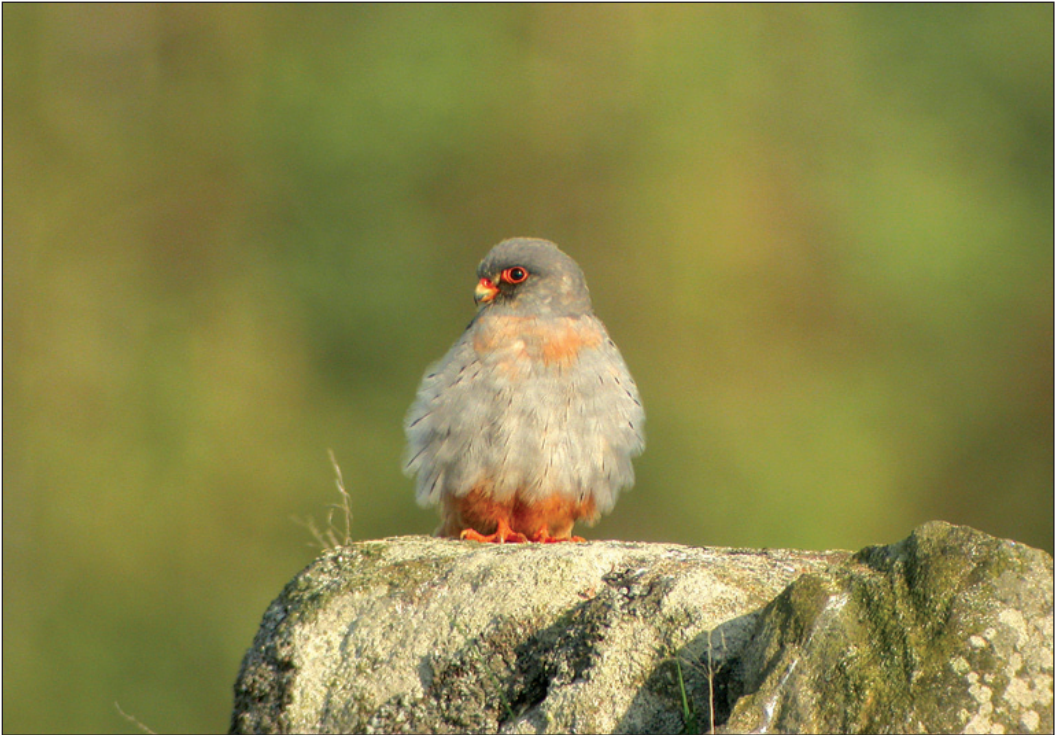
Aftenfalk Falco vespertinus er blitt en nærmest årlig gjest i Farsund kommune (VA). Her en 2K hann på Lista fyr 5. juni 2003.

(Tundraområder i Sibir fra Yamal ved ca. 70° Ø og østover til vestlige Alaska. Overvintringsområdet er enormt, og strekker seg fra sørlige USA til østlige Afrika). Etter mange funn i 2000 og 2001 er dette eneste funn i løpet av de to påfølgende årene. Det første funnet på Jæren siden et par gjestet Nærlandstranden 11-13.6.1993 (Gustad 1995).