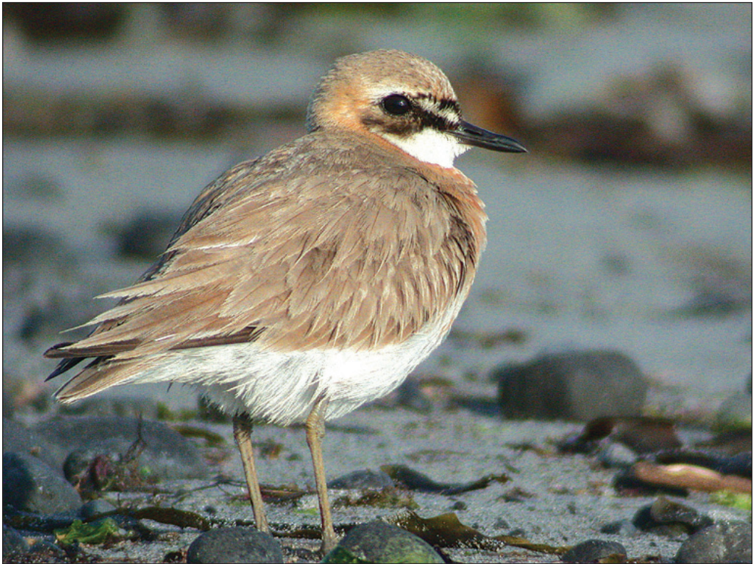
Ørkenlo Charadrius leschenaultii fra Lista, Farsund (VA) 6.-10. mai 2003. Fuglen, som viser karakterer til den vestlige underarten columbinus , var fjerde funn i Norge og det andre fra Lista.