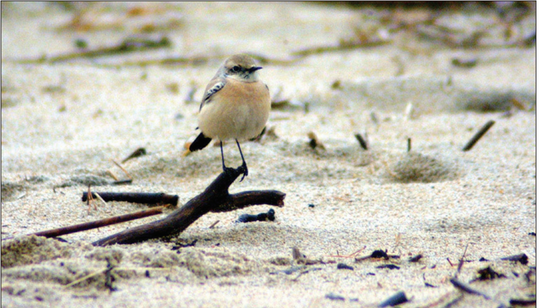
Ørkensteinskvetvett Oenanthe deserti fra Sjøsandene, Mandal (VA) 16.-28. november 2003. Fuglen var en av tre ørkensteinskvetvetter som gjestet Norge i løpet av november 2003.