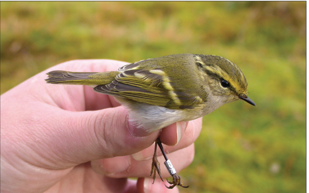
Høsten 2003 vil nok av mange huskes for den sterke forekomsten av fuglekongesanger Phylloscopus proregulus . Denne fuglen ble ringmerket på Titran, Frøya, Sør-Trøndelag 11. oktober 2003.