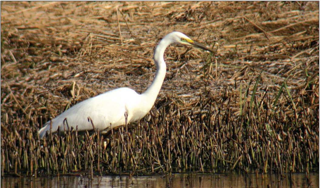
Egretthege Ardea alba. Fuglen fra Tørvikvatnet, Kvam (HO) 1.-6. april 2003 viser en typisk opptreden i Norge, hvor mange funn stammer fra april måned.