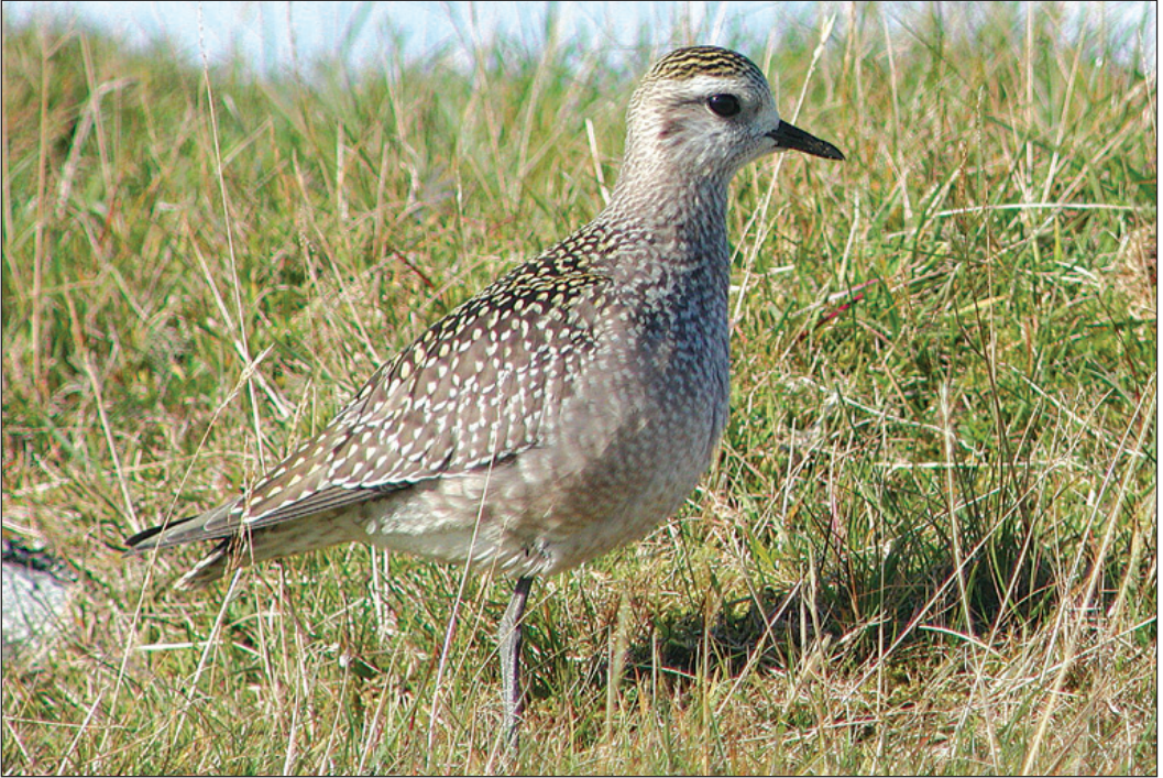
Kanadalo Pluvialis dominica på Røst (NO) 26. september 2003. Funnet viser nok en gang hvilken magnet for sjeldne fugler denne øya utyrtst i Lofoten er. Tross en betydelig større forekomst i våre naboland er dette kun det andre funnet i Norge. Førstefunnet er fra Lista, Farsund (VA) i 2002.

Svartehavsmåke Larus melanocephalus (33 - 6) 2003 TELEMARK: 1K Jomfruland, Kragerø 7.9* (F) (*F.Haga, E.Edwardsen, Ø.W. Johannessen). 1K Jomfruland, Kragerø 5. og 10.-11.10* (F) (*J.H.Magnussen, C.Sunding, J.Myromslien, T.Holtskog). 1K Jomfruland, Kragerø 28.10 (*E.Edwardsen, B.Kjellemyr, F.Haga, O.Nordsteien, T.Martinsen). VEST-AGDER: 1K Tjomsemoen, Søgne 8.10* (F) (*P.Knutson, H.V.Løkken, R. Tømmerstø, J.M.Abrahamson m.fl.). ROGALAND: 2K Mosvatnet og Breiavatnet, Stavanger 1.-19.1* (F+V) (*F.Jacobsen, m.fl.). 2K Kvasseheim, Hå 19.6-2.7* (F) (*K.R.Mjølshesnes m.fl.). 2K Vigrestad og Håtangen, Hå 30.6 og 2.-3.7* (F) (*K.R. Mjølshesnes, *M.Eggen, G.Mobakken). 2K 1km N for Madland havn, Hå 8.7 (*B.Kjellemyr, B.Bech). 1K Tjelta, Sola 9.9* (F) (*M.Eggen m.fl.).