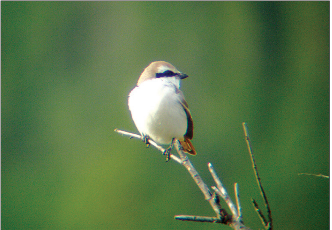
Et sjeldent innlandsfunn av en sjelden art. Adult hann rødhalevarsler Lanius isabellinus av underarten phoenocuroides fra Hemsedal (BÜ) 20.-21. september 2003.