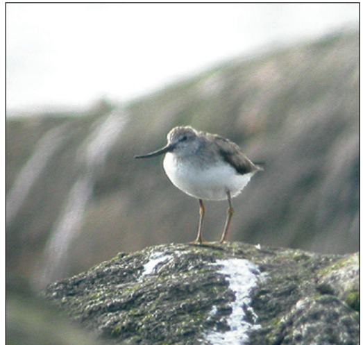
Tereksnipe Xenus cinereus fra Lista fyr, Farsund (VA) 27.-28. juni 2003. Dette er første funn av arten i Vest-Agder.