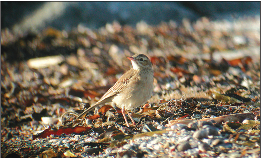
En omdiskutert piplerke som etter hvert fikk endelig status som markpiplerke Anthus campestris. Fuglen holdt seg på en stubbåker og sandstrand i Tarevika, Karmøy (RO) store deler av november 2003.