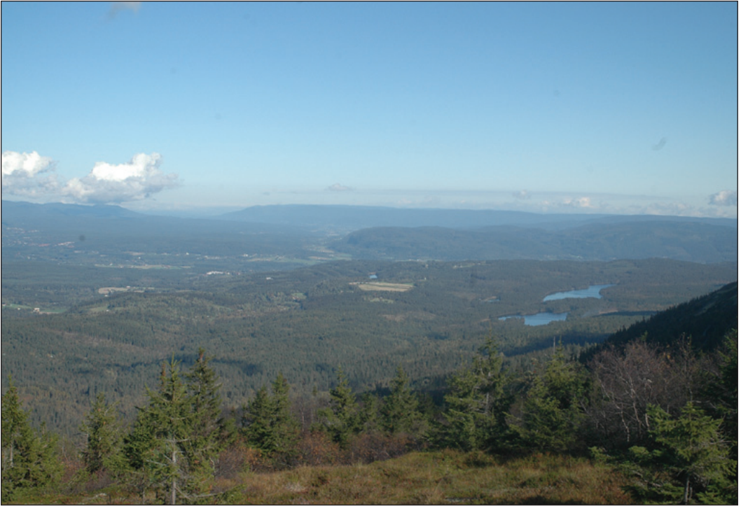
Figur 2. Oversiktsbilde over Øvre Sandsvær, tatt fra Hoenseterfjell, Skrimfjella. Overnattingsplassen ligger midt i bildet, i nedkant av det dyrkede området.

Overview over Øvre Sandsvær, taken from Hoenseterfjell, Skrimfjella mountain ridge. The common roost in the centre of the picture, in front of the cultivated area.