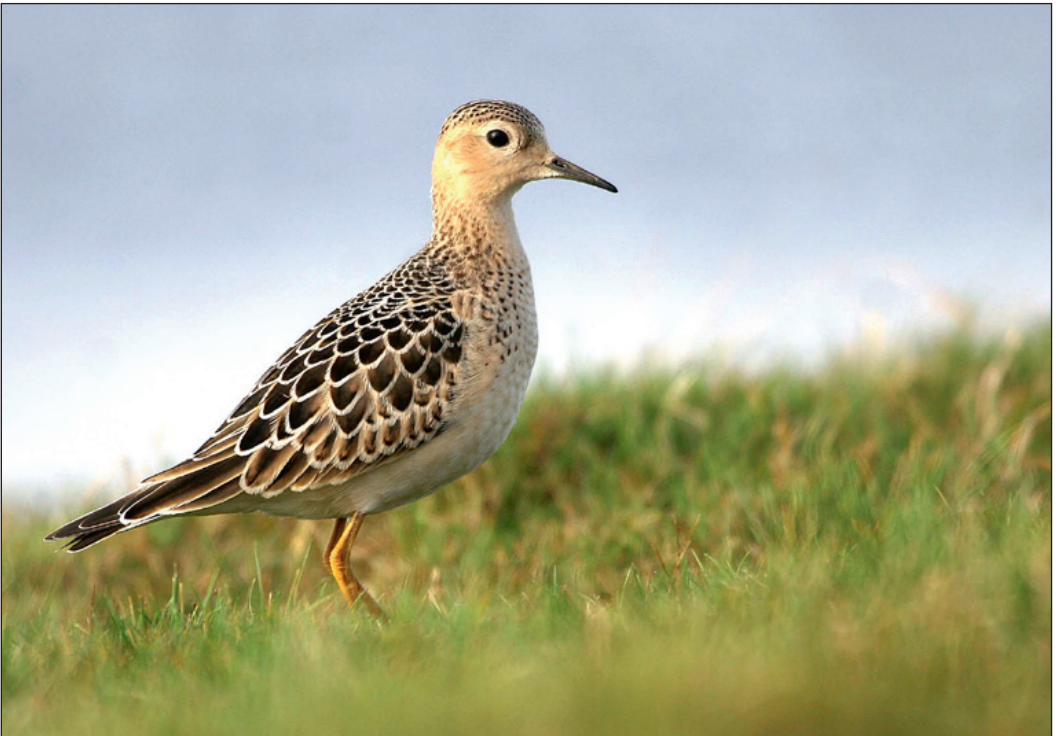
En ungfugl av rustsnipe Tryngites subruficollis rastet på Røst i Nordland ultimo september til medio oktober.