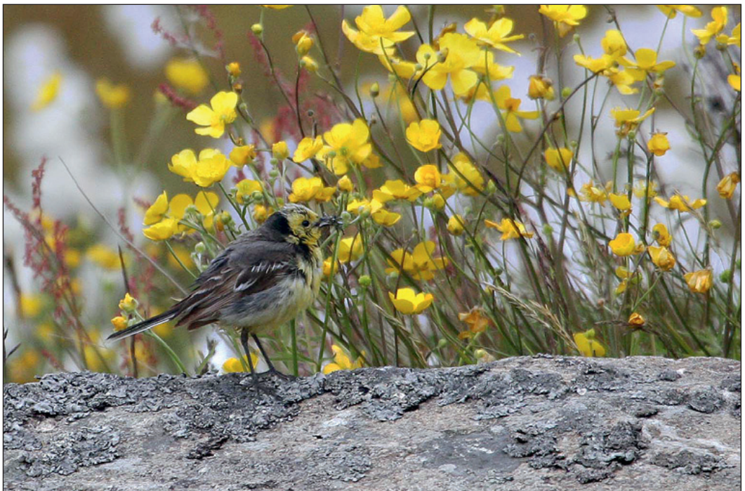
En citronerle Motacilla citreola hann hekket i sammen med hunn av såerle M. f. thunbergi på Røst i Nordland.