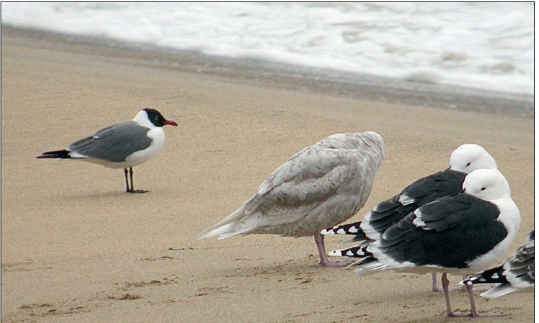
Voksen lattermåke Larus atricilla i sammen med polarmåker Larus hyperboreus og svartbak Larus marinus på Bjørnøya, Svalbard 12. juni 2006.