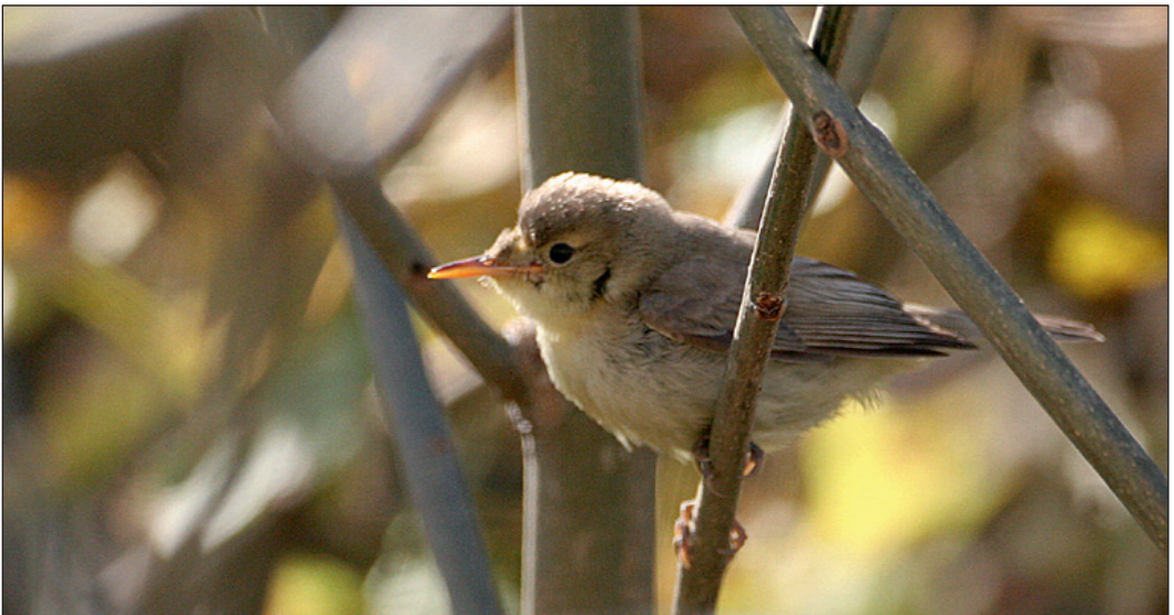
Norges fjerde spottesanger Hippolais polyglotta ble sett på Odderøya, Kristiansand i Vest-Agder 2. november 2007.