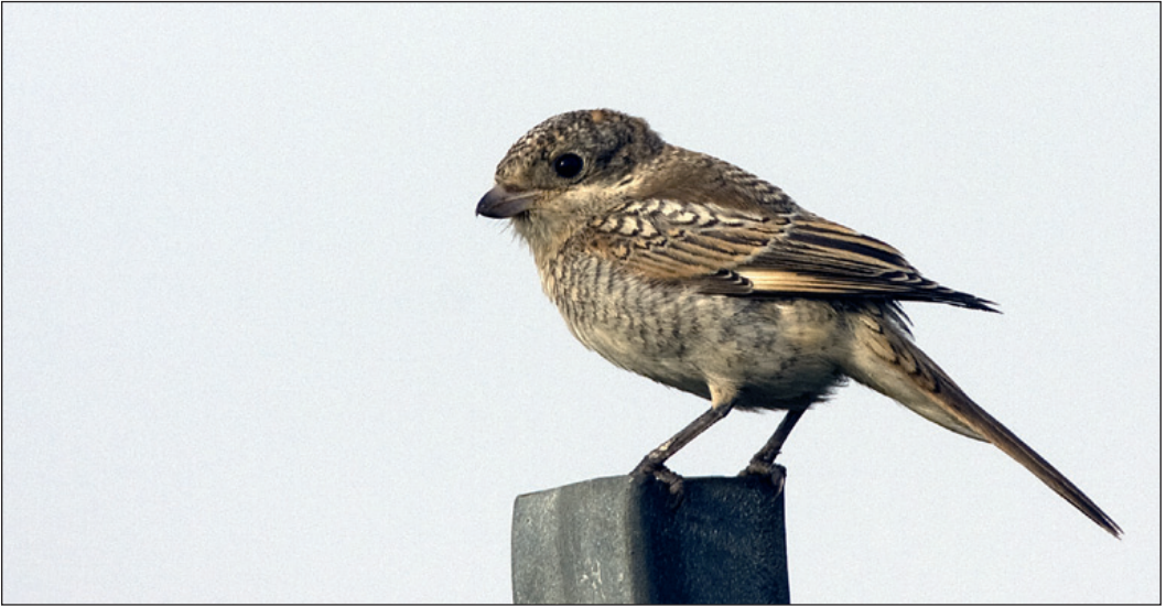
For andre året på rad ble rødhodevarsler Lanius senator observert på Lista i Vest-Agder. Denne ungfuglen oppholdt seg ved Nordhassel første halvdel av oktober.