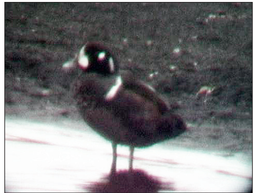
En voksen hann harlekinand Histrionicus histrionicus ble sett noen dager i slutten av juni 2002 på Jan Mayen, Svalbard.

(Island, Grønland, Nord-Amerika og Øst-Sibir). Med dette funnet står 2002 som eneste år med mer enn ett funn av arten. En hann hadde tilhold ved Stad, Sogn og Fjordane fra 14. september til 19. oktober samme år. Funnet på Jan Mayen kan trolig settes i direkte sammenheng med mytetrekk hos den islandske bestanden.