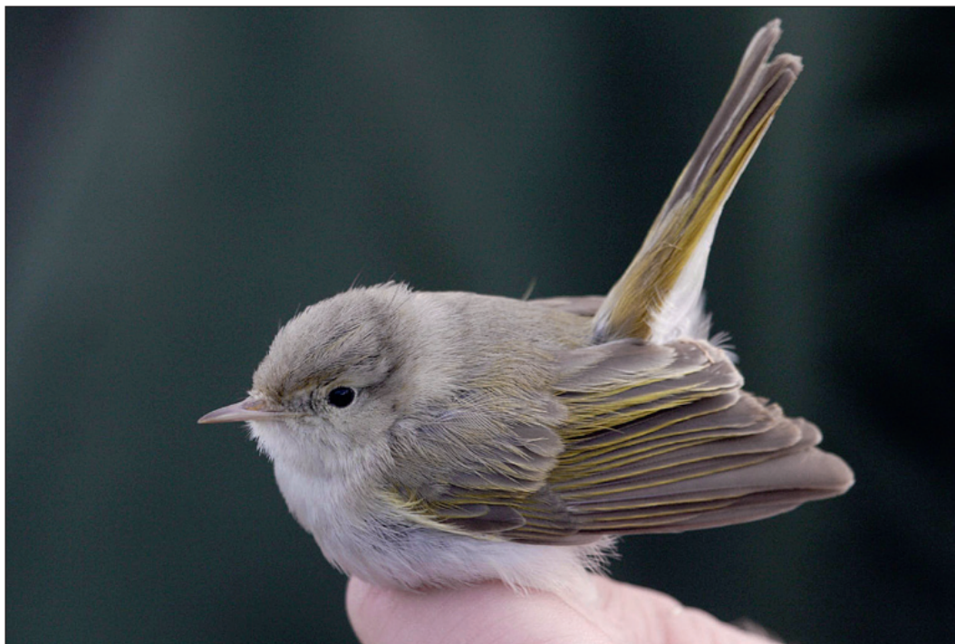
Røst sitt andre funn av furusanger Phylloscopus orientalis ble gjort i september 2007. Lokkelyd er det sikreste kjennetegnet for å skille arten i forhold til den nærbeslektede eikesanger Phylloscopus bonelli.