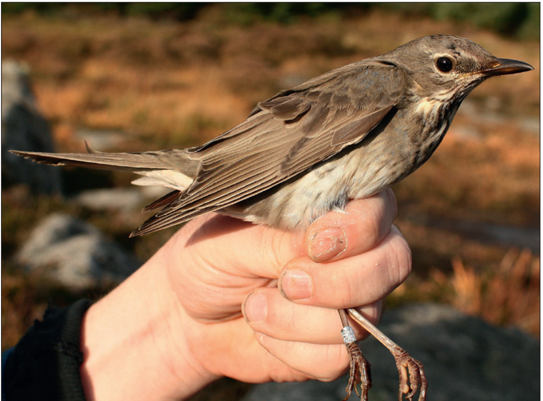
En ung hunn svartstrupetrost Turdus atrogularis ble fanget og ringmerket på Utsira i Rogaland 7. oktober.