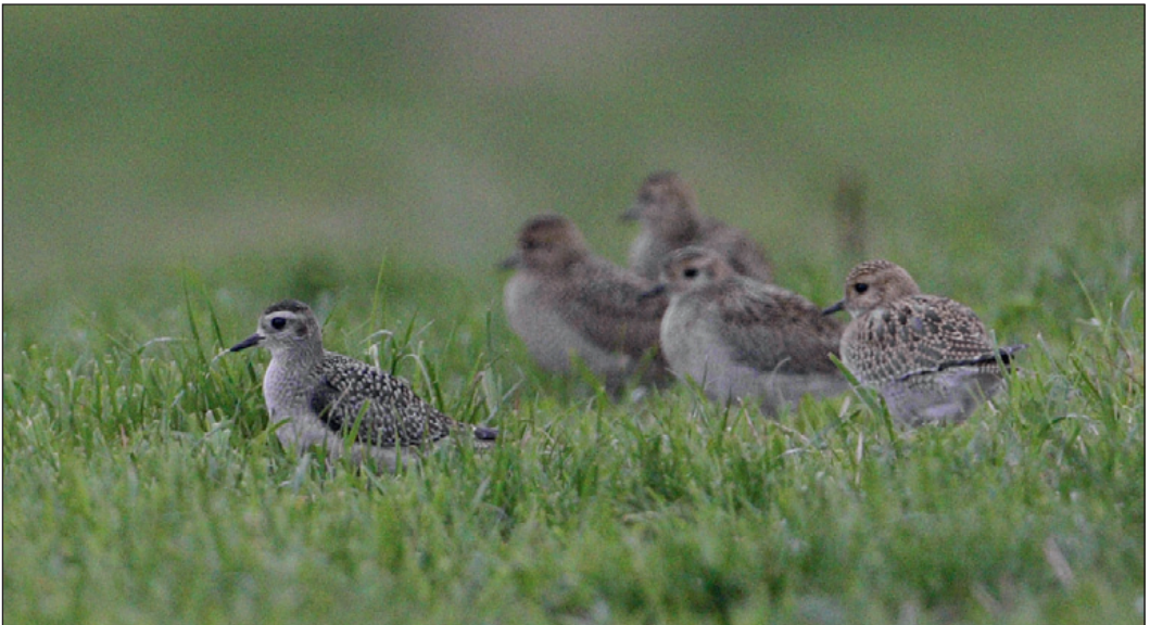
Norges andre ungfugl av kanadalo Pluvialis dominica ble sett ved Gossen, Aukra i Møre og Romsdal i månedsskiftet september-oktober. Legg merke til en betydelig gråere drakt og en tydeligere lys øyenbrynstripe i forhold til de unge heiloene Pluvialis apricaria til høyre.