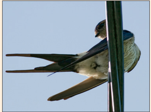
Adult amursvale Cecropis daurica av nominatunderarten daurica. Kårstø, Tysvær i Rogaland 22.8.2007.