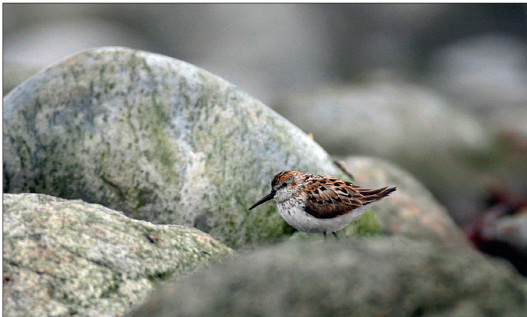
Ny art for landet! En voksen beringsnipe Calidris mauri gjestet Revtangen i Rogaland 12.-13. juli.

Rapport fra Norsk sjeldenhetskomité for fugl (NSKF)