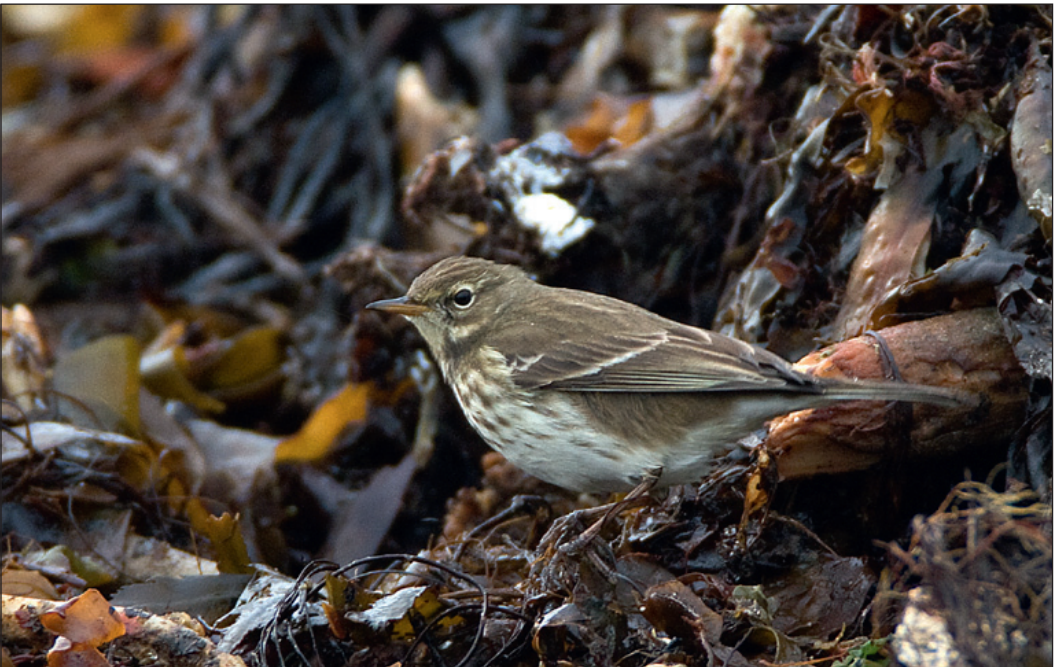
En klassisk tegnet vannpiplerke Anthus spinoletta fra Vågsvollvika, Farsund i Vest-Agder november 2007.