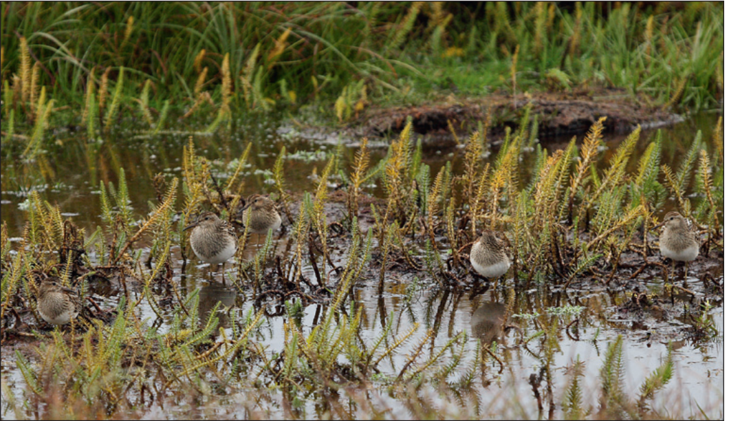
«All time high»! Som mest ble det sett 5 alaskasniper Calidris melanotos samtidig på Røst i Nordland under høsten.