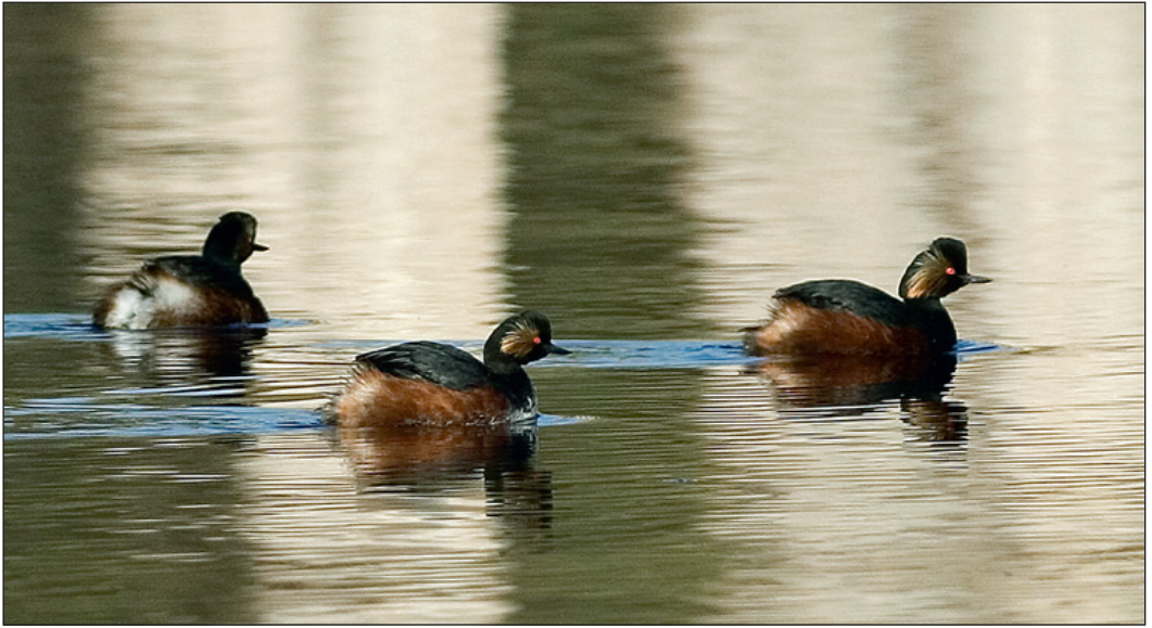
Hele tre svarthalsdykkere Podiceps nigricollis ble sett i Dokkadeltaet i Oppland i slutten av april 2007.