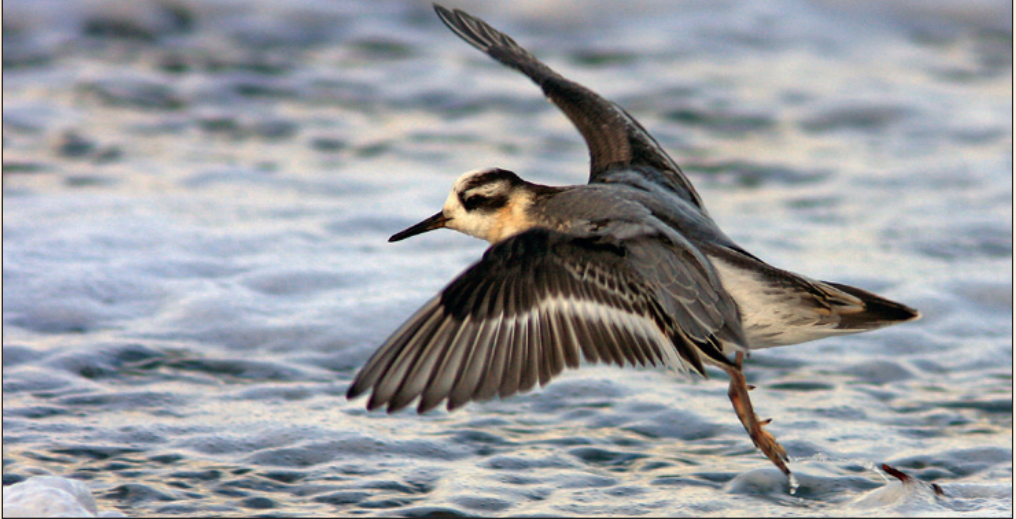
Juvenil polarsvømmesnipe Phalaropus fulicarius . Samme fugl som er avbildet på s. 20.

Perioden 1950 til 2008 er det godkjent 120 funn (166 ind.) av polarsvømmesnipe Phalaropus fulicarius i Norge. Også før 1950 ble arten observert en rekke ganger langs kysten i høst- og vintermånedene, men noen komplett oversikt over disse funnene finnes ikke. På grunnlag av disse godkjente funnene er det NSKFs vurdering at artens forekomst i Norge er tilstrekkelig dokumentert til at den fremtidige behandlingen kan fortsette på fylkesnivå. Komiteen har også vektlagt at arten er forventet å forekomme i norske (hav)områder som følge av regulært trekk mellom hekke- og overvintringsområdene.