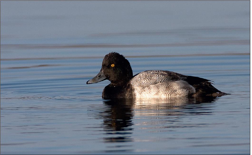
Norges tredje og Vest-Agders første purpurhodeand Aythya affinis gjestet Kråkenesvann, Farsund i to måneder i slutten av 2007. Bildet nedenfor viser karakteristisk vingebåndtegning med hvit arm og mørkere brunrå hånd. Fotos: Gunnar Gundersen.