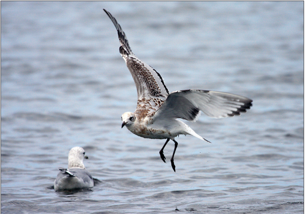
Ungfugl av svartehavsmåke Larus melanocephalus fra Nærlandsstranden, Hå i Rogaland 26. august.