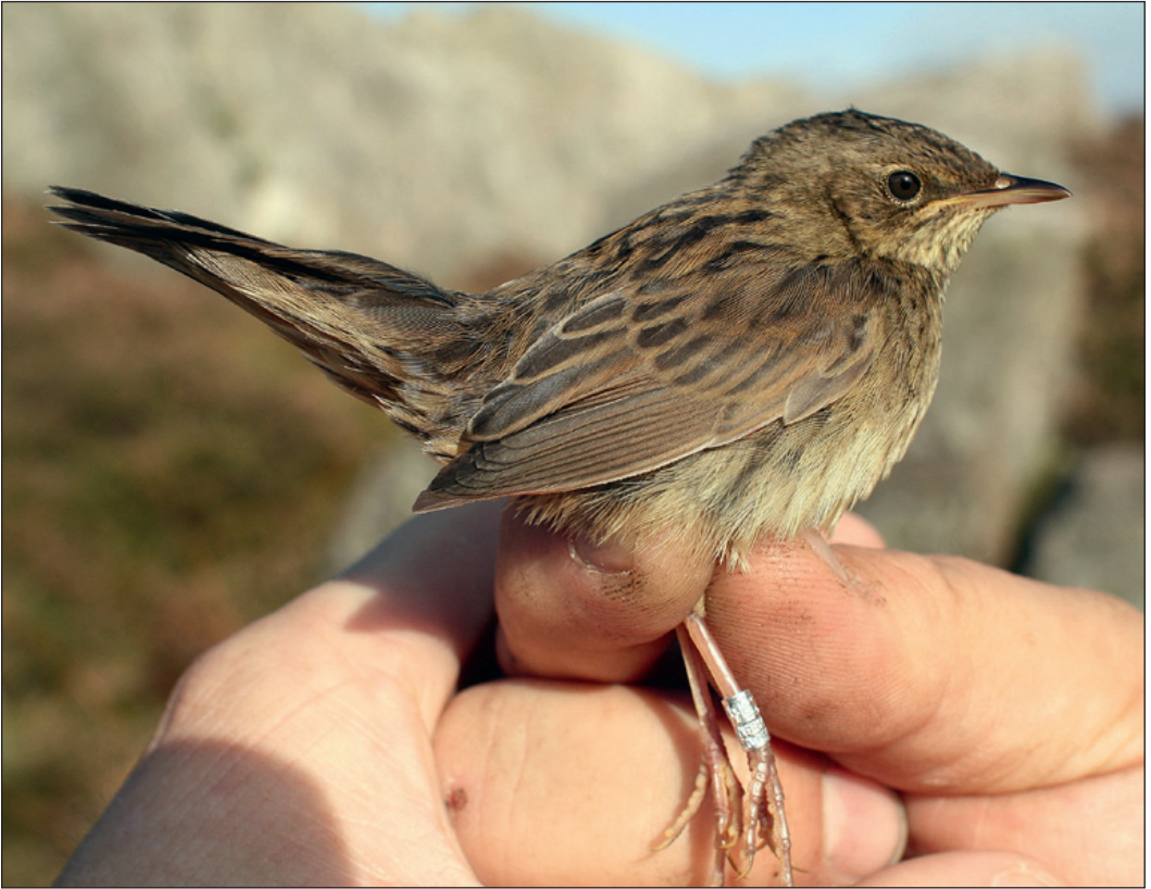
En stripesanger Locustella lanceolata ble fanget og ringmerket på Utsira i Rogaland 1. oktober.