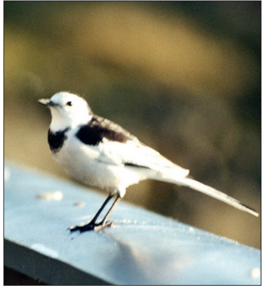
Ny underart for Norge! En voksen hunn av linerleunderarten leucopsis gjestet Lista i Vest-Agder to dager i begynnelsen av november. Fuglen rakk dessverre å forsvinne før funnet ble allment kjent, men den ble heldigvis godt dokumentert.