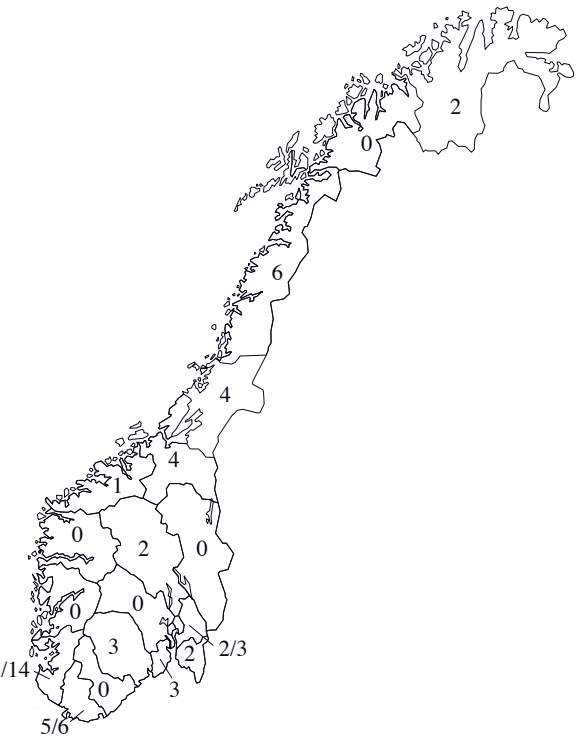
Figur 1. Geografisk fordeling av funn av hvitvingesvarterne Chlidonias leucopterus i Norge (funn/individer).

2008 VEST-AGDER: 2K+ Lista fyr, Farsund 18.5 (*V.Bunes, *H.Hveding, O.Heggøy, K.D.Larsen m.fl.). MØRE OG ROMSDAL: 2K+ Nerland, Fræna 9.5* (F) (T.H.Hansen).