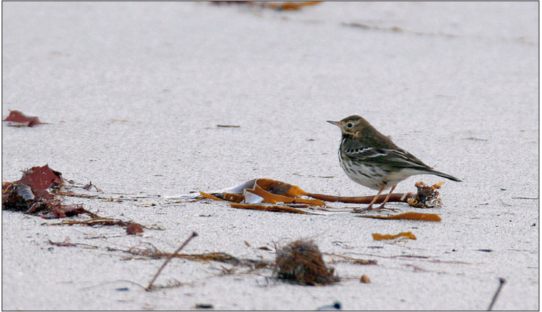
Ny underart for landet! En myrpiplerke Anthus rubescens som viste karakter til underarten japonicus overvintret på Karmøy i Rogaland fra medio januar til primo april. Noen viktige kjennetegn for å skille underartene japonicus og rubescens fra hverandre er blant annet undersidens farge og streking, samt beinfarge.