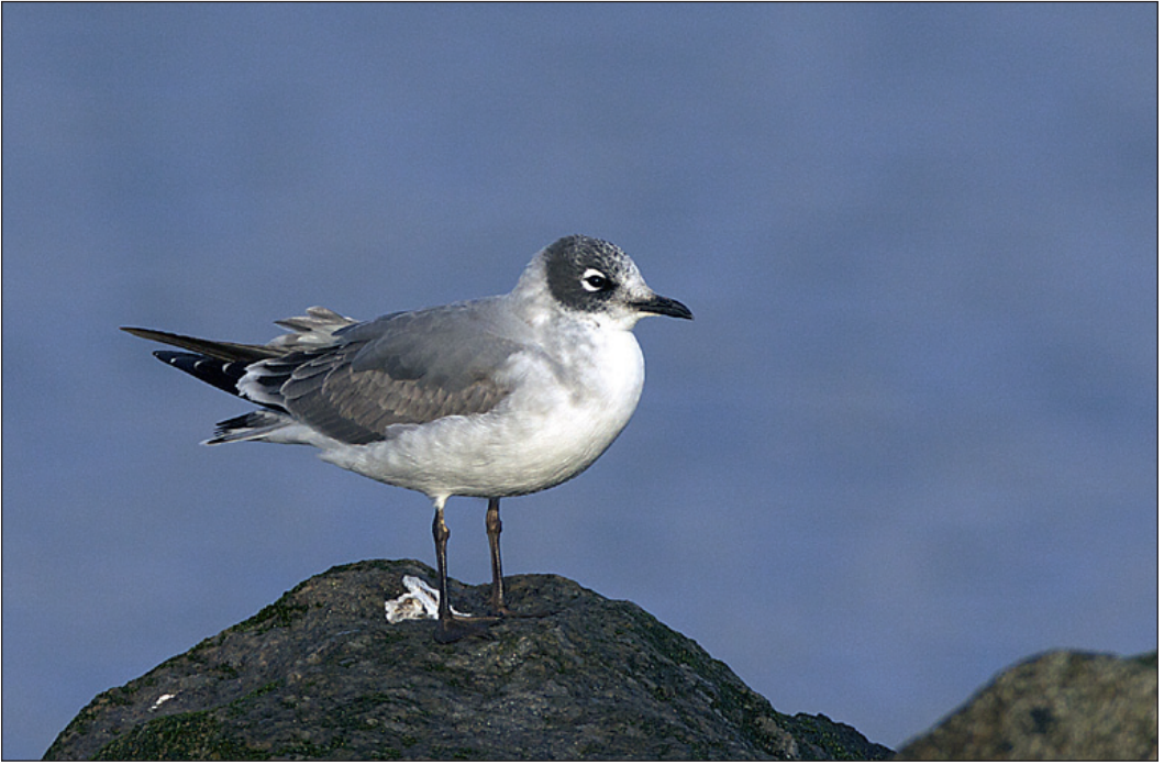
Ung franklinmåke Larus pipixcan fra Sola i Rogaland i november.