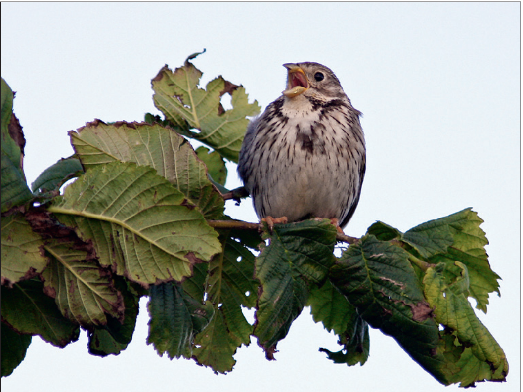
En av to syngende kornspurver Emberiza calandra som hadde tilhold ved Skeie, Klepp i Rogaland i juli.