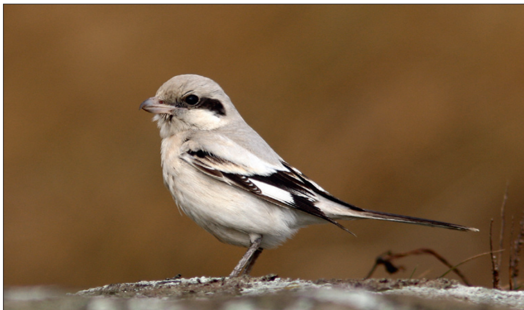
Norges syvende steppevarler Lanius m. pallidirostris hadde tilhold en drøy uke ved Taravika, Karmøy i Rogaland ultimo oktober.