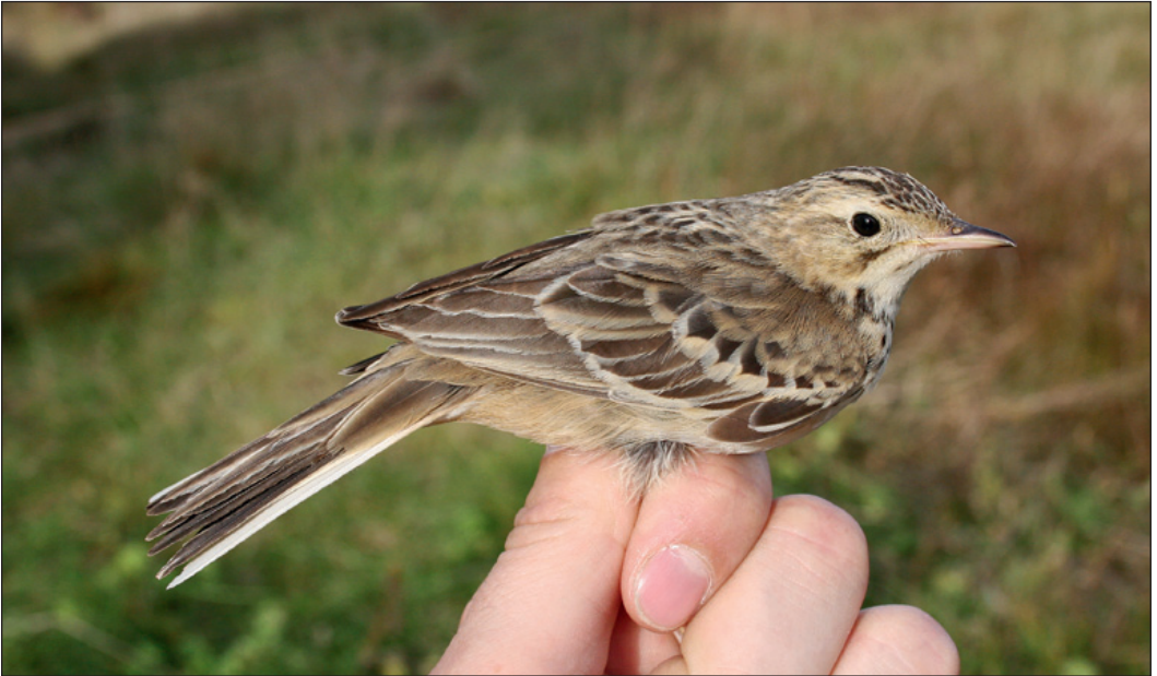
Denne ungfugl av mongolpiplerke Anthus godlewskii ble fanget og ringmerket på Titran, Frøya i Sør-Trøndelag 4. oktober 2007. Legg merke til at den innerste av mellomdekkerne er myttet og er av adult type. Tegningen på de adulte mellomdekkerne er en viktig artskarakter i forhold til tartarpiplerke Anthus richardi .