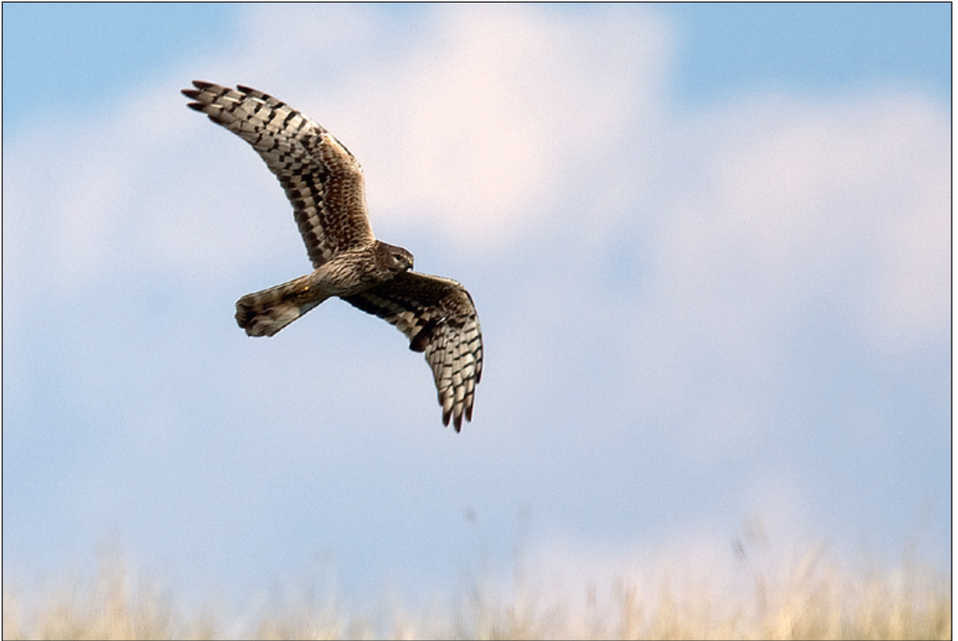
Adult ♀ enghauk Circus pygargus fra Lista i Vest-Agder i mai. Smal vinge med kun fire «fingre» skiller den fra myrhauk. En viktig karakter for å skille den fra hunn steppehauk i samme alder er tegningen på undersiden av de indre armsvingfjærene. Som bildet viser har enghauken en tydelig og distinkt båndning på en jevn og lys bunnfarge.