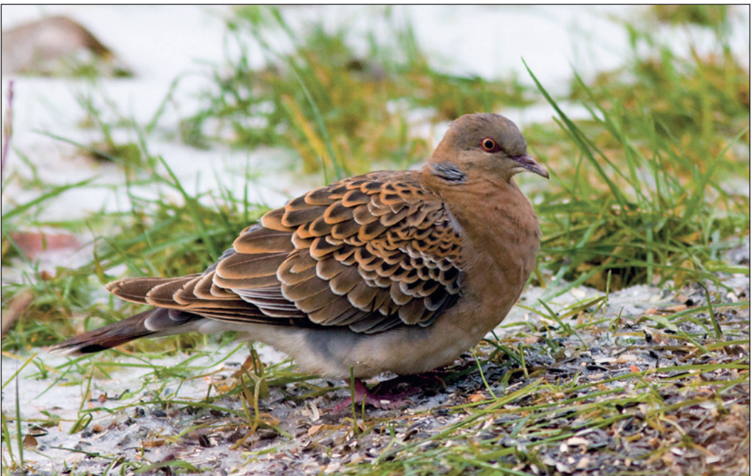
Denne mongolturteldua Streptopelia orientalis, trolig tilhørende underarten meena, ble sett ved Larseng i Troms i perioden 25. oktober til 9. november.