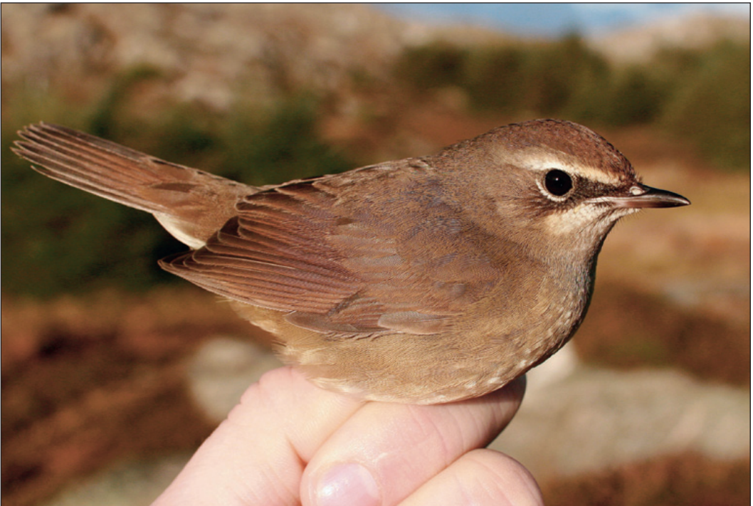
Norge og Utsira sin andre rubinstrupe Luscinia calliope ble fanget og ringmerket på Utsira i Rogaland 1. november.