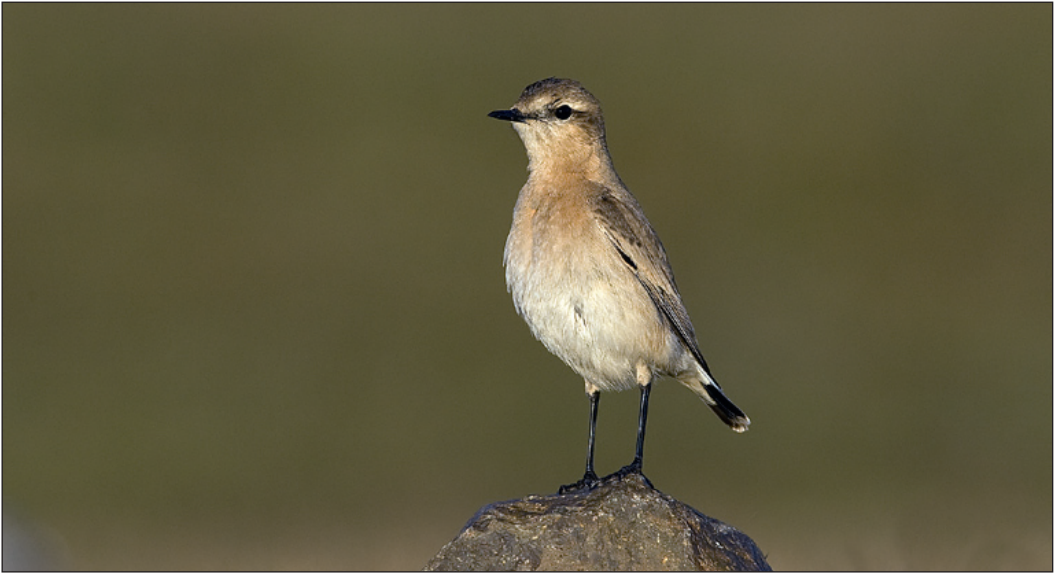
Vest-Agders første isabellasteinskvett Oenanthe isabellina hadde tilhold ved Haugestranda, Farsund noen dager i månedsskiftet oktober/november.