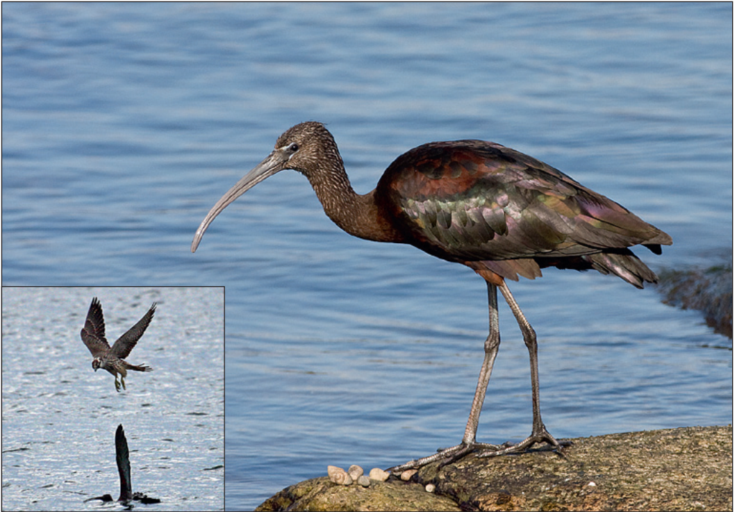
Bronseibisen Plegadis falcinellus som holdt til på Lista i september unngikk såvidt å bli lunsj for både vandre-falk Falco peregrinus (innfelt bilde) og hønehawk Accipiter gentilis . En artsfrende som gjestet Skåne i Sverige en del år tilbake var ikke like heldig – den endte sine dager i klørne på nettopp en hønehawk.